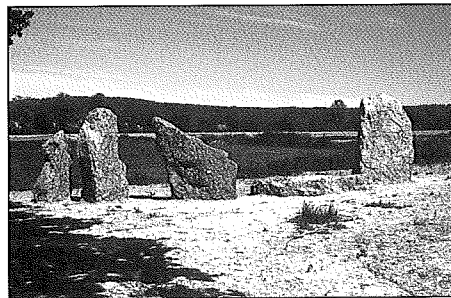
Les menhirs n°s I, III, IV et V redressés.

Les blocs ont, semble-t-il, été renversés et enfouis vers le XVI e siècle. Depuis cette époque, ils étaient couchés sur une ligne plus ou moins sud/nord. On s'est longtemps interrogé sur leur signification. Constituaient-ils des menhirs ? S'agissait-